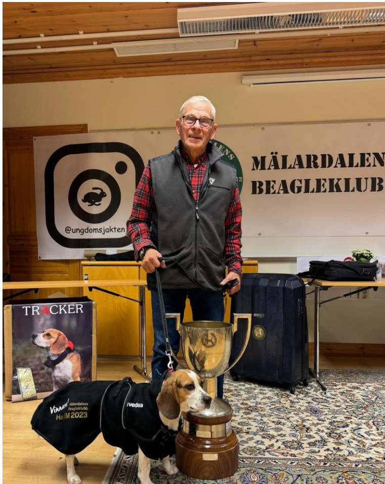
En stolt husse med 2023 års SM-vinnare, Sjöhorvans Saga, som gjort en mycket fin prestation.